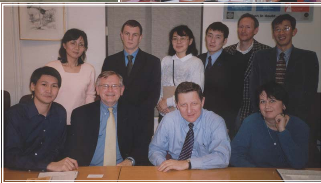
Стажеры (действующие координаторы экономического развития) на встрече с представителями Всемирного Банка в России ноябрь 2002 г., Москва