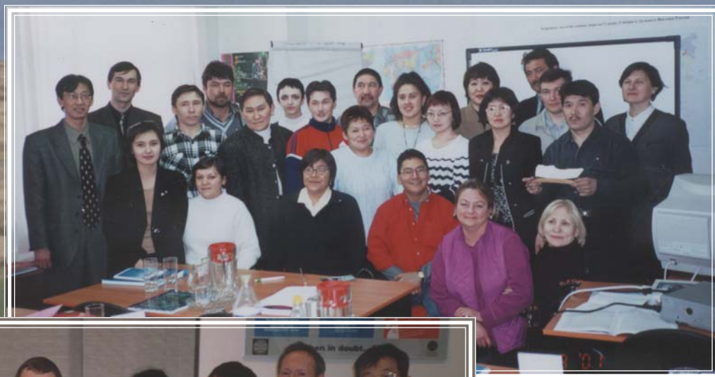
Первая группа стажёров РИТЦ февраль-март 2001 г. Москва